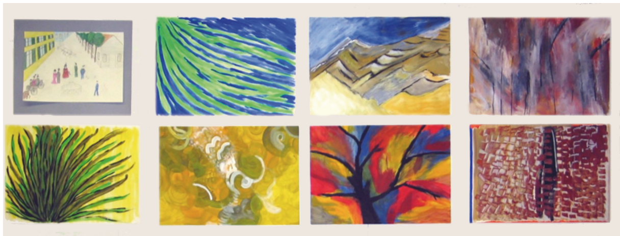
Abbildung 4: Bilderrwand