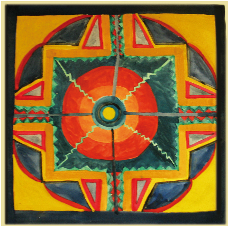
Abbildung 3: Mandala