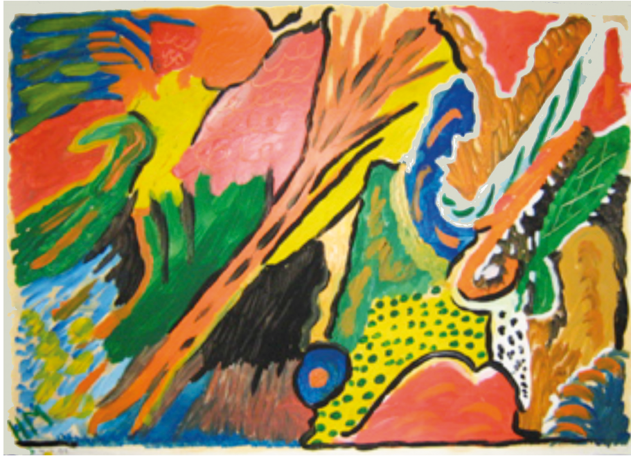
Abbildung 2: Mexico